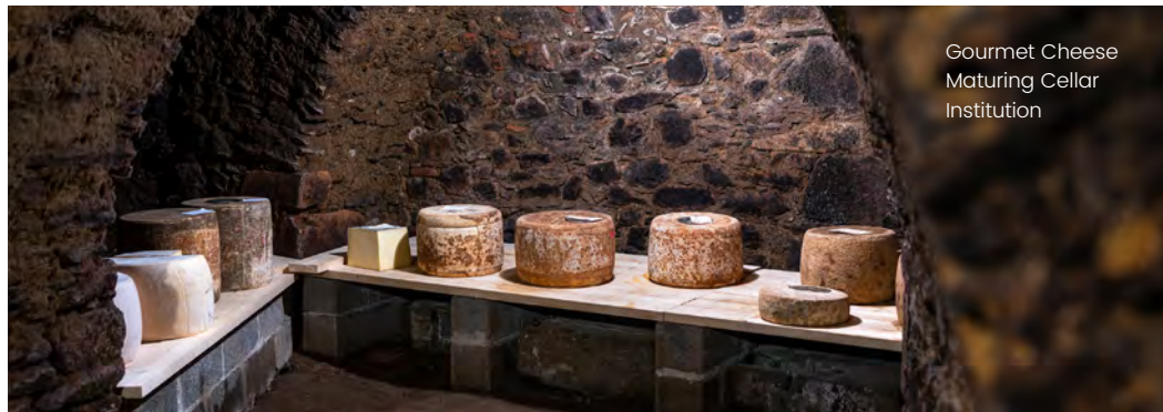
Gourmet Cheese Maturing Cellar Institution